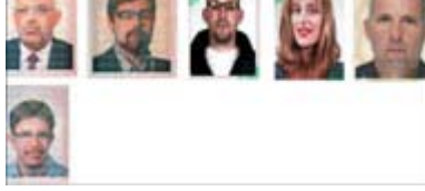
صور فريق اغتيال المبحوح (الفرنسية)