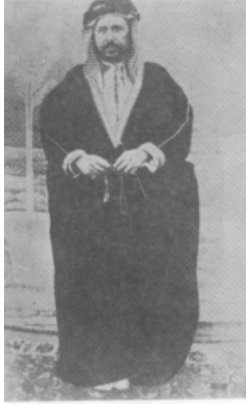
الشيخ خزعل بن جابر امير عربستان